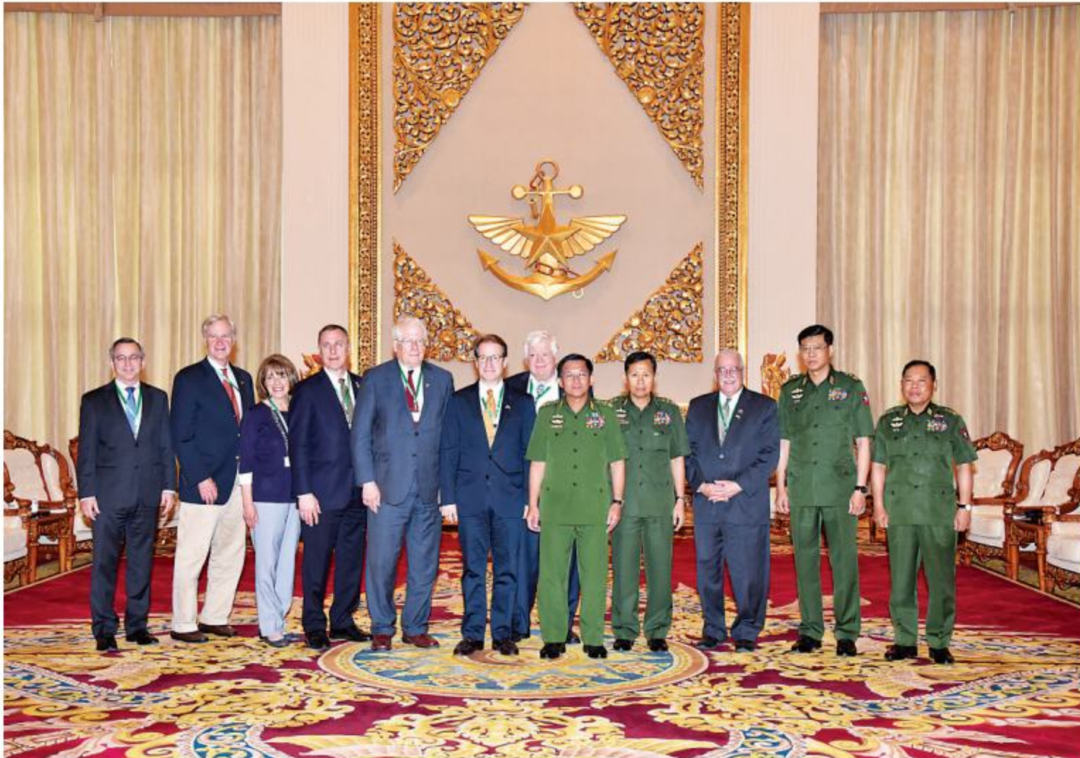
Senior General Min Aung Hlaing and party pose for a documentary photo together with House Democracy Partnership Chairman Mr. Peter Roskam of the United States Congress and congressmen.