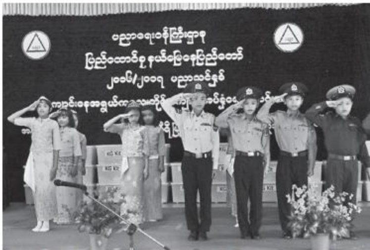
အသီးသီးက လက်ခံရယူသည်။ ဆက်လက်၍ အမှတ်(၁၄)အခြေခံပညာအထက်တန်းကျောင်းမှ ကျောင်းသား၊ ကျောင်းသူလေးများက ပြည်မြန်မာသီချင်းဖြင့် သီဆိုဖော်ဖြေကြပြီး အခမ်းအနားကို ရုပ်သိမ်းလိုက်သည်။

နေပြည်တော် မေ ၃၁ - နေပြည်တော်ကောင်စီနယ်မြေ ဇေယျသီရိမြို့နယ်၌ ကျောင်းနေအရွယ်ကလေးတိုင်း ကျောင်းအပ်နံရေးနေ့အခမ်းအနားကို ယမန်နေ့ နံနက် ၉ နာရီက အမှတ်(၁၄)အခြေခံပညာအထက်တန်းကျောင်း၌ ကျင်းပရာ အမှတ်(၂၂)အခြေခံပညာအထက်တန်းကျောင်းမှ ကျောင်းသား၊ ကျောင်းသူလေးများက ကျောင်းအပ်နံရေးနေ့သီချင်းဖြင့် သီဆိုဖွင့်လှစ်ပေးသည်။