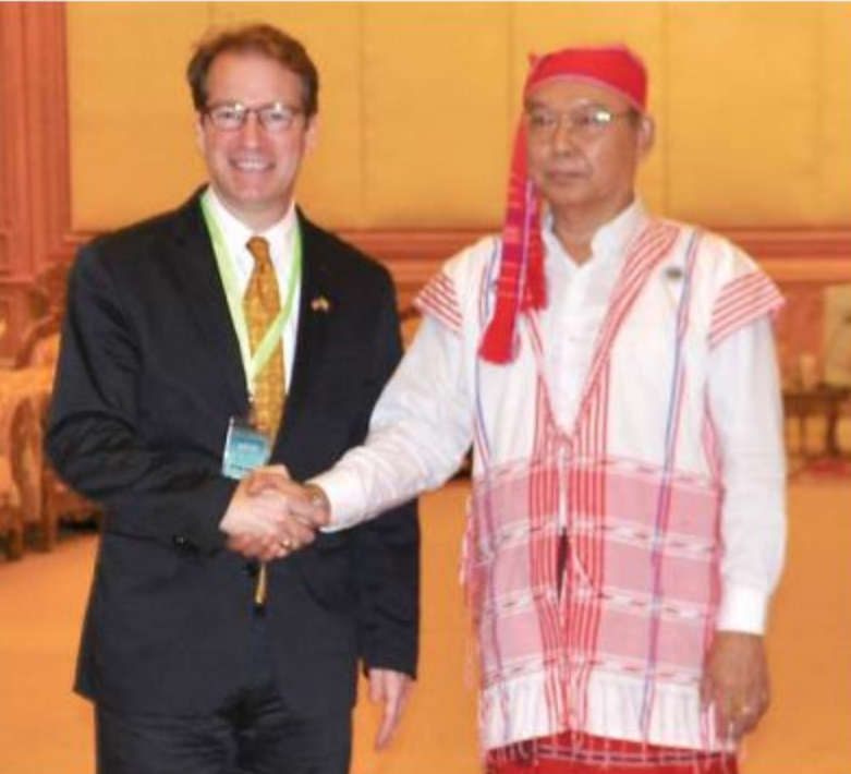
ပြည်ထောင်စုလွှတ်တော်နာယက အမျိုးသားလွှတ်တော်ဥက္ကဋ္ဌ မန်းဝင်းခိုင်သန်း အမေရိကန်ကွန်ဂရက်၊ House Democracy Partnership ဥက္ကဋ္ဌ Mr. Peter Roskam အား ရင်းနှီးမှုနှုတ်ဆက်စဉ်။

နေပြည်တော် မေ ၃၁ မြန်မာနိုင်ငံလွှတ်တော်နှင့် အမေရိကန်ကွန်ဂရက် အောက်လွှတ်တော်တို့အကြား ချစ်ခင်ရင်းနှီးသော ဆက်ဆံရေးဖော်ဆောင်ရန်၊ မြန်မာနိုင်ငံ၏ ဒီမိုကရေစီဖော်ဆောင်ရေးလုပ်ငန်းစဉ်များတွင် ဆက်လက်အားပေးကူညီရန်ကိစ္စရပ်များနှင့်ပတ်သက်၍ ပြည်ထောင်စုလွှတ်တော်နာယက၊ အမျိုးသားလွှတ်တော်ဥက္ကဋ္ဌ မန်းဝင်းခိုင်သန်းသည် အမေရိကန်ကွန်ဂရက်၊ House Democracy Partner-