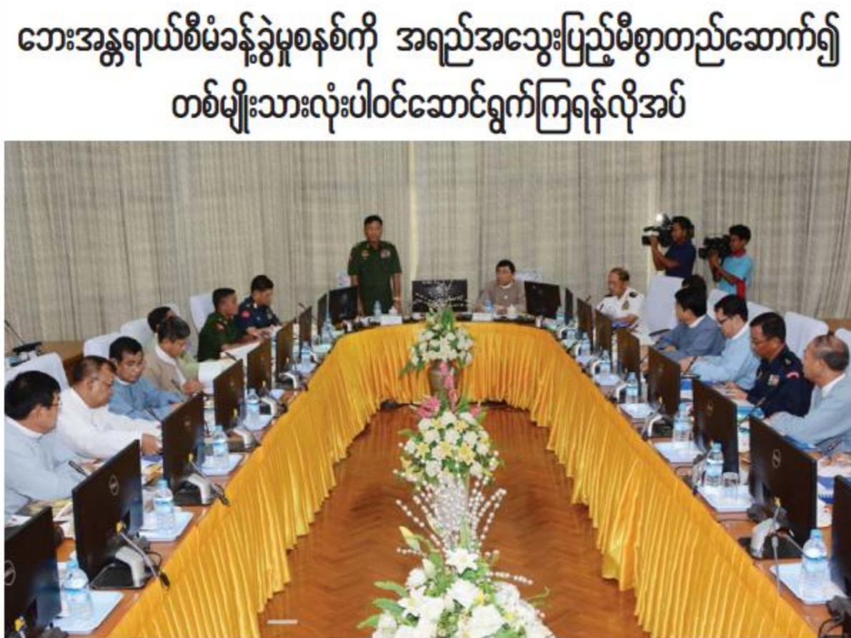
ပြည်ထောင်စုဝန်ကြီး ဒုတိယဗိုလ်ချုပ်ကြီးကျော်ဆွေ မြန်မာနိုင်ငံအမျိုးသားရွာစွာကယ်ဆယ်ရေးကော်မတီ ပထမအကြိမ်အစည်းအဝေးတွင် အမှာစကားပြောကြားစဉ်၊

မည်သည့်ဘေးအန္တရာယ်မဆို ကြိုတင်ပြင်ဆင်ရန်ဆိုင်ရမည်ဖြစ်ကြောင်း ပြည်ထောင်စုဝန်ကြီး ဒုတိယဗိုလ်ချုပ်ကြီးကျော်ဆွေက ယနေ့မနက်လွဲ ၂ နာရီတွင် ပြည်ထောင်စုဝန်ကြီးဌာန အစည်းအဝေးခန်းမ၌ကျင်းပသည့် မြန်မာနိုင်ငံ အမျိုးသားရွာစွာကယ်ဆယ်ရေးကော်မတီ ပထမအကြိမ်အစည်းအဝေးတွင်ပြောကြားသည်။ ထို့ပြင် ပြည်ထောင်စုဝန်ကြီးက မြန်မာနိုင်ငံအနေဖြင့် မမျှော်လင့်သည့် ဘေးအန္တရာယ် ကျရောက်သည့်အချိန်တွင် အမြန်တုံ့ပြန်နိုင်ရေးအတွက် ဘေးအန္တရာယ်ဖြစ်နိုင်ခြေလျော့ချပြီး ကြိုတင်ကာကွယ်ခြင်း၊ ကြိုတင်ပြင်ဆင်ခြင်း၊ အရေးပေါ်တုံ့ပြန်ခြင်းနှင့် ပြန်လည်ထူထောင်ခြင်း စသည့်အဆင့်လေးဆင့်ပါဝင်သည့်ဘေးအန္တရာယ်စီမံခန့်ခွဲမှုစနစ်ကို အရည်အသွေးပြည့်မီစွာတည်ဆောက်၍ တစ်မျိုးသားလုံးပါဝင်ဆောင်ရွက်ကြရန် လိုအပ်ကြောင်းကိုလည်း ထည့်သွင်းပြောကြားသည်။ အဆိုပါအစည်းအဝေးတွင် ကော်မတီဒုတိယဥက္ကဋ္ဌ လူမှုဝန်ထမ်း ကယ်ဆယ်ရေးနှင့် ပြန်လည်နေရာချထားရေးဝန်ကြီးဌာန ပြည်ထောင်စုဝန်ကြီး ဒေါက်တာဝင်းမြတ်အေး၊ ရွာစွာကယ်ဆယ်ရေးကော်မတီမှ ဦးတင်ဦးဦး တက်ရောက်လာကြသူများက သဘာဝဘေးအန္တရာယ်