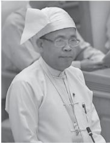
နိုင်ငံခြားရေးဝန်ကြီးဌာန ဒုတိယဝန်ကြီး ဦးကျော်တင်

နေပြည်တော် မေ ၃၁ မြန်မာနိုင်ငံအနေဖြင့် ယခုသဘောတူစာချုပ်ကို အတည်ပြုပေးရန်အတွက် မြန်မာနိုင်ငံမှ အာဆီယံအတွင်းရေးမှူးချုပ်ရုံးတွင် တာဝန်ယူဆောင်ရွက်နေသည့် အာဆီယံဆိုင်ရာ မြန်မာအမြဲတမ်းကိုယ်စားလှယ်၊ သံအမတ်ကြီးနှင့်ဝန်ထမ်းများအနေဖြင့် ၎င်းတို့၏လုပ်ငန်းတာဝန်များ ထမ်းဆောင်ရာတွင် ကင်းလွတ်ခွင့်နှင့် အခွင့်အရေးများရရှိကြမည်ဖြစ်ကြောင်း နိုင်ငံခြားရေးဝန်ကြီးဌာန ဒုတိယဝန်ကြီး ဦးကျော်တင်က “အာဆီယံ၏ ကင်းလွတ်ခွင့်နှင့် အခွင့်အရေးများဆိုင်ရာ သဘောတူစာချုပ်ကို မြန်မာနိုင်ငံမှအတည်ပြုပေးရန်အတွက် နိုင်ငံရေး၊ ကိစ္စနှင့်စပ်လျဉ်း၍ ယနေ့ကျင်းပသည့် ပြည်ထောင်စုလွှတ်တော် အစည်းအဝေးတွင် ရှင်းလင်းတင်ပြသည်။ အာဆီယံ၏ ကင်းလွတ်ခွင့်နှင့်အခွင့်အရေးများဆိုင်ရာ သဘောတူစာချုပ်ကို ထိုင်းနိုင်ငံ ချာအမ်း-ဟာဟင်းမြို့တွင် ၂၀၀၉ ခုနှစ် အောက်တိုဘာ ၂၇ ရက်က မြန်မာနိုင်ငံအပါအဝင် အာဆီယံအဖွဲ့ဝင် ၁၀ နိုင်ငံမှ နိုင်ငံခြား