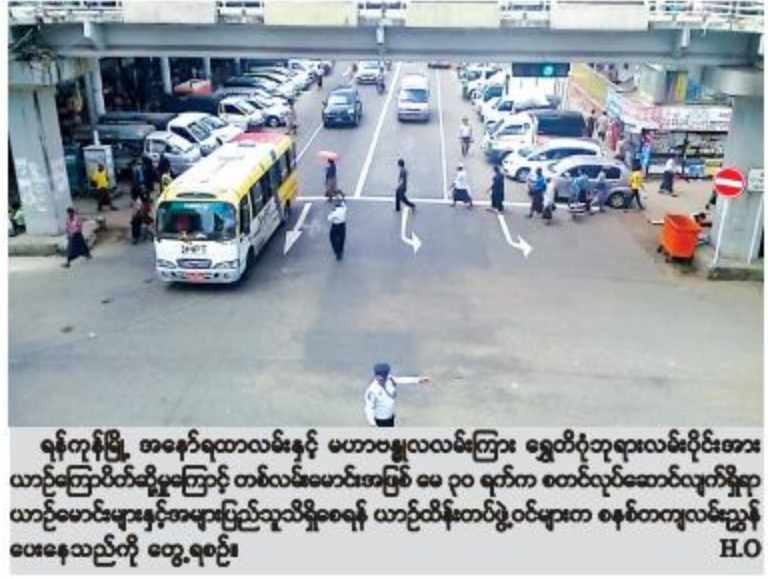
ရန်ကုန်မြို့ အနောက်ရထားလမ်းနှင့် မဟာဗန္ဓုလလမ်းကြား ရွှေတိဂုံဘုရားလမ်းပိုင်းအား ယာဉ်ကြောပိတ်ဆို့မှုကြောင့် တစ်လမ်းမောင်းအဖြစ် ၈၀ ရက်က စတင်လုပ်ဆောင်လျက်ရှိရာ ယာဉ်မောင်းများနှင့်အများပြည်သူလိုရရန် ယာဉ်တိမ်းတစ်ဝှမ်းဝှမ်းတ ဓနစ်တကျလမ်းညွှန်ပေးနေသည်ကို တွေ့ရပုံ။