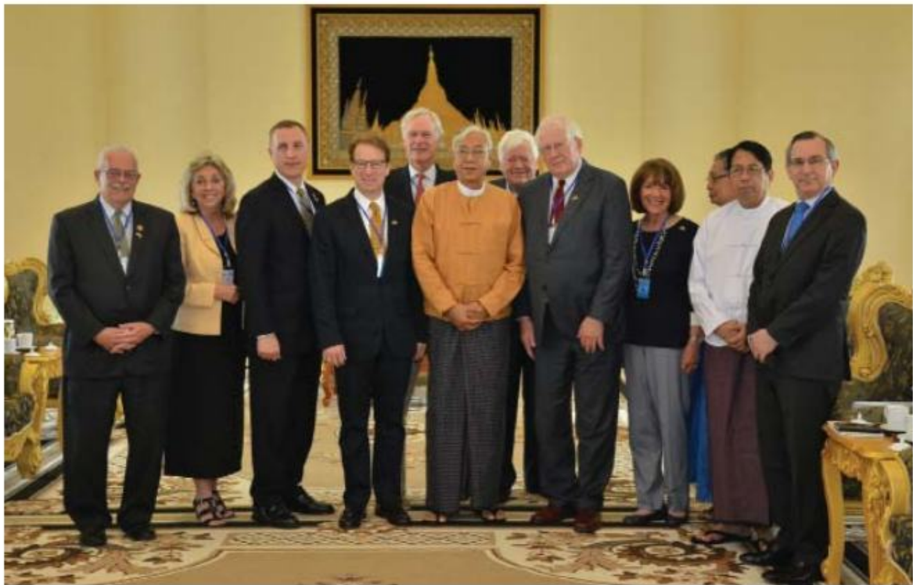
နိုင်ငံတော်သမ္မတ ဦးထင်ကျော်နှင့် အမေရိကန်တွန်ဝရက်၊ House Democracy Partnership ဥက္ကဋ္ဌ Mr.Peter Roskam တို့အဖွဲ့ဝင်များနှင့်အတူ စုပေါင်းဓာတ်ပုံ ဖြတ်စဉ်။

နေပြည်တော် ၁၁ မေ ၂၀၁၆ - ပြည်ထောင်စုသမ္မတမြန်မာနိုင်ငံတော် နိုင်ငံတော် သမ္မတ ဦးထင်ကျော်သည် အမေရိကန်တွန်ဝရက်၊ House Democracy Partnership ဥက္ကဋ္ဌ Mr.Peter Roskam ဦးဆောင်သည့်လွှတ်တော် အဖွဲ့နှင့် တွေ့ဆုံဆွေးနွေးခဲ့သည်။