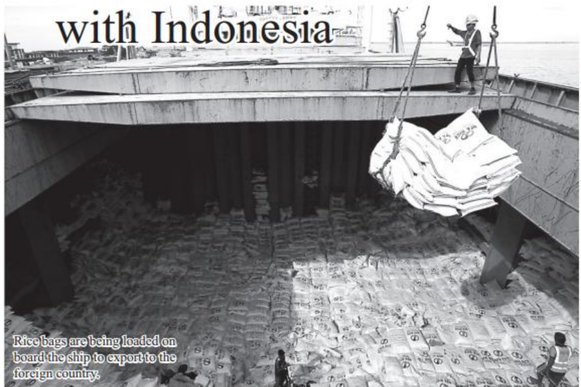
Rice bags are being loaded on board the ship to export to the foreign country.

"For the time being, we've just signed MoU on rice export to Indonesia. We have some quality pro-