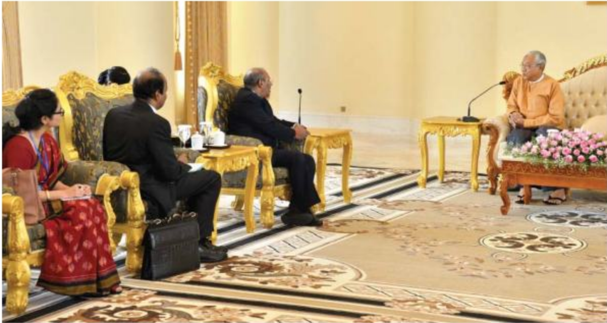
နိုင်ငံတော်သမ္မတ ဦးထင်ကျော် အိန္ဒိယနိုင်ငံသံအမတ်ကြီး မစ္စတာ ဂေါ်တမ်မုနို ပါမီသအား လက်ခံတွေ့ဆုံစဉ်၊