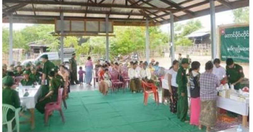
တောင်ပိုင်းတိုင်းစစ်ဌာနချုပ် နယ်လှည့်ဆေးကုသရေးအဖွဲ့ ဒေသခံပြည်သူများအား ကျန်းမာရေး စောင့်ရှောက်မှုလုပ်ငန်းများဆောင်ရွက်ပေးစဉ်။

နေပြည်တော် ၁၁ မေ ၃၁ ပဲခူးတိုင်းဒေသကြီး၊ တောင်ငူမြို့နယ်၊ မွေတော်စစ်မှုထမ်းဟောင်းအိမ်ရာရှိ စစ်မှု ထမ်းဟောင်းများ၊ မိသားစုဝင်များနှင့် ဒေသခံ ပြည်သူများအား ယနေ့နံနက်ပိုင်းတွင် တောင် ပိုင်းတိုင်းစစ်ဌာနချုပ် နယ်လှည့်ဆေးကုသ ရေးအဖွဲ့က ကျန်းမာရေးစောင့်ရှောက်မှု လုပ်ငန်းများဆောင်ရွက်ပေးရာ သားဖွား မီးယပ်ရောဂါ၊ သွေးတိုးရောဂါ၊ အစာအိမ် ရောဂါ၊ အရိုးရောဂါနှင့် အထွေထွေရောဂါ ဝေဒနာရှင် ၁၄၇ ဦးအား ဆေးကုသမှုများ ဆောင်ရွက်ပေးသည်။ ထိုသို့ဆောင်ရွက်ပေးနေမှုများကို တိုင်း စစ်ဌာနချုပ်မှ တာဝန်ရှိသူများက သွားရောက် ကြည့်ရှုအားပေးပြီး ဆေးရုံတက်ရောက်ကုသ ရန်လိုအပ်သော ဒေသခံပြည်သူ လေးဦးအား တောင်ငူမြို့ရှိ နယ်မြေခံဆေးတပ်ရင်းသို့ ပို့ဆောင်ကုသနိုင်ရေး စီစဉ်ဆောင်ရွက်ပေးခဲ့ ကြောင်းသတင်းရရှိသည်။ (၁၀၀)