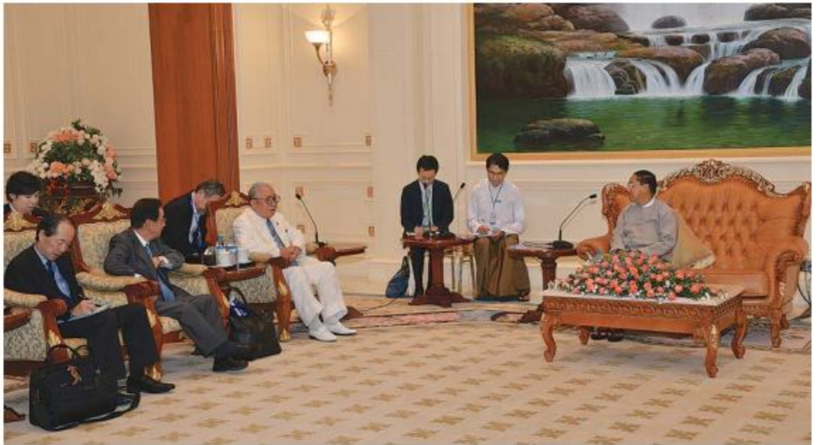
ဗုတိယသမ္မတ ဦးမြင့်ဆွေနှင့် ဂျပန်-မြန်မာအသင်းဥက္ကဋ္ဌ Mr. Hideo WATANABE တို့ တွေ့ဆုံဆွေးနွေးစဉ်၊ ဓာတ်ပုံ-တင်ဦးဦး

ရန်ကုန်-မန္တလေးအမြန်လမ်းမကြီးတွင် နေ့စဉ်သွားလာမောင်းနှင်နေသော မော်တော်ယာဉ်စီးရေမှာ ၁၉၇၀၀ ဝန်းကျင်ရှိကြောင်း သိရသည်။ မော်တော်ယာဉ်များ အန္တရာယ်ကင်းစွာ မောင်းနှင်နိုင်ရေးနှင့် ခရီးသည်များအတွက်အဆင်ပြေစေရန် ယာဉ်ရပ်နားခရီးများကိုလည်း သက်ဆိုင်ရာတို့ကစီစဉ်ပေးထားသည့်အပြင် အမြန် လမ်းမကြီးရံတပ်ဖွဲ့စခန်းများကလည်း စောင့်ရှောက်အကူအညီပေးလျက်ရှိရာ အားလုံး ခရီးစဉ်ချောမွေ့ရေး ယာဉ်မောင်းသူများက အထူးအလေးထားမောင်းနှင်ကြပါရန် မြဝတီကတိုက်တွန်းနှိုးဆော်လိုက်ရပါသည်။