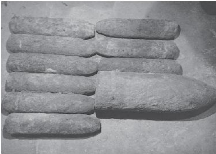
ခုံးသီးဟောင်းများကို တွေ့ရစဉ်။

လုံး၊ စုစုပေါင်း သံချေးတက်ခုံးသီးဟောင်း ၁၀ လုံးအားတွေ့ရှိသဖြင့် နယ်မြေခံစစ်မြေပြင်အင်ဂျင်နီယာတပ်သို့ စနစ်တကျအပ်နှံပြီး ခုံးသီးဟောင်းများအား လုပ်ထုံးလုပ်နည်းနှင့် အညီဖောက်ဖွဲ့ဖျက်ဆီးနိုင်ရေး ဆက်လက်ဆောင်ရွက်သွားမည်ဖြစ်ကြောင်း သတင်းရရှိသည်။ (၁၀၀)