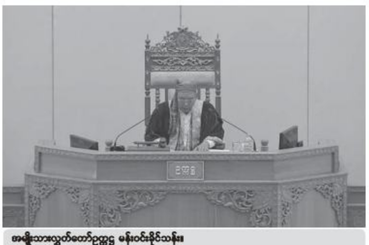
အမျိုးသားလွှတ်တော်ဥက္ကဋ္ဌ မန်းဝင်းနိုင်သန်း။

၄၈ နာရီကြိုတင်၍ စာဖြင့်ပေးပို့တင်ပြရမည်။ စိတန်းလှည့်လည်ရာတွင် ဖြတ်သန်းလိုသည့် မြို့နယ်များရှိပါက သက်ဆိုင်ရာမြို့နယ် ရဲတပ်ဖွဲ့မှူးမှူးထံ ၄၈ နာရီကြိုတင်၍ အသိ ပေးတင်ပြချက်မိတ္တူကိုပေးပို့ရမည်” ဟု ပြင်ဆင် အတည်ပြုခဲ့သည်။ ထို့ပြင် ဥပဒေကြမ်း၏စည်းကမ်းသတ်မှတ် ချက်များအခန်း အပို ၉ တွင် လူသား အချင်းချင်းမတူကွဲပြားမှုကြောင့် ခွဲခြားခံရချ ခြင်း၊ ဂုဏ်သိက္ခာညှိုးနွမ်းစေခြင်းတို့ကို ရည်ရွယ် သောအပြုအမူ အပြောအဆိုတို့ကိုမပြုလုပ်ရ။ ငြိမ်းချမ်းစွာစုဝေးခြင်းနှင့် စိတန်းလှည့်လည် ခြင်းတို့ပြုရာတွင် သူတစ်ဦးဦးအား ငွေကြေး သို့မဟုတ် ပစ္စည်းတစ်စုံတစ်ရာပေး၍ ပါဝင် စေခြင်း၊ ငွေကြေး သို့မဟုတ် ပစ္စည်းတစ်စုံ တစ်ရာလက်ခံ၍ ပါဝင်ခြင်းတို့ မပြုလုပ်ရ။ ငြိမ်းချမ်းစွာစုဝေးခြင်းနှင့် စိတန်းလှည့်လည် ခြင်းတို့ပြုရာတွင် သူတစ်ဦးဦးအားပါဝင်စေ ရန်ခြိမ်းခြောက်ခြင်း၊ အတင်းအကျပ်ပြုခြင်း၊ အနိုင်အထက်ပြုခြင်း၊ မလျော်ကြာသည့်ခြင်းတို့ မပြုလုပ်ရ။ ဤဥပဒေပါ စည်းကမ်းချက်များနှင့် ဒေသဆိုင်ရာလိုအပ်ချက်နှင့်အညီ တာဝန်ရှိ ပုဂ္ဂိုလ် သို့မဟုတ် အဖွဲ့အစည်းများမှ ကြိုတင် သတ်မှတ်ထားသော စည်းကမ်းချက်များကို ဖောက်ဖျက်ခြင်းမပြုရမည် ဖြည့်စွက်ချက် များကို ထည့်သွင်းအတည်ပြုခဲ့သည်။ ထို့အတူ စည်းကမ်းသတ်မှတ်ချက်များ