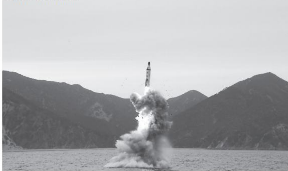
Image released by KCNA of the underwater test-fire of a strategic submarine ballistic missile.

"We are analysing and closely monitoring the situation and maintaining a watertight defence posture," he added.