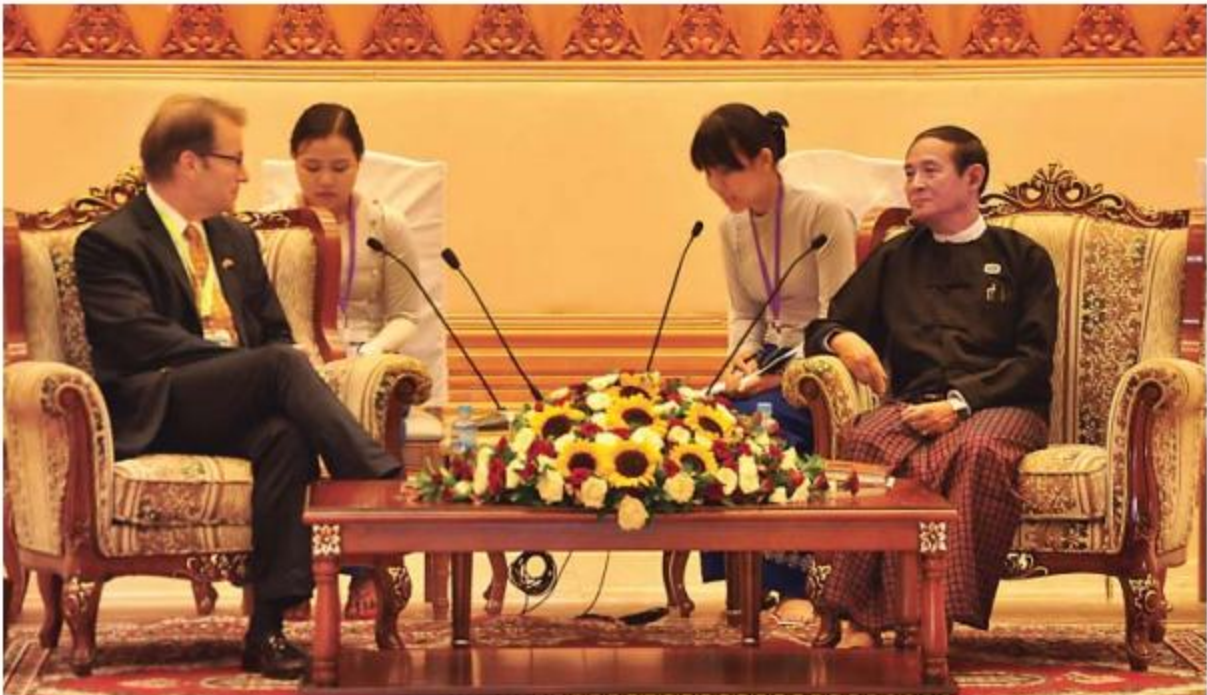
ပြည်သူ့လွှတ်တော်ဥက္ကဋ္ဌ ဦးဝင်းမြင့် အမေရိကန်ကွန်ဂရက်၊ House Democracy Partnership ဥက္ကဋ္ဌ Mr. Peter Roskam အား လက်ခံတွေ့ဆုံစဉ်။

အစိုးရအချင်းချင်း၊ လွှတ်တော်အချင်းချင်း ချစ်ကြည်ရင်းနှီးမှုနှင့် ပူးပေါင်းဆောင်ရွက်ရေး ဆိုင်ရာကိစ္စရပ်များနှင့်ပတ်သက်၍ အမြင်ချင်း ဖလှယ်ဆွေးနွေးခဲ့ကြသည်။ (သတင်းစဉ်)