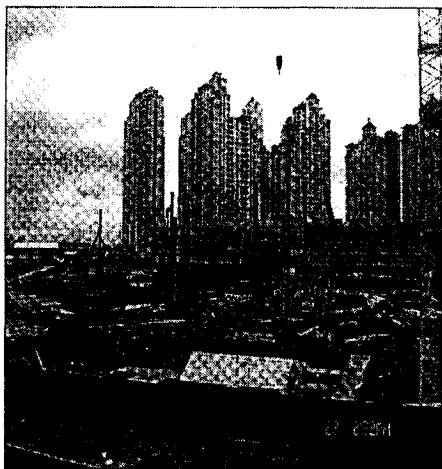
Memajukan ekonomi negara