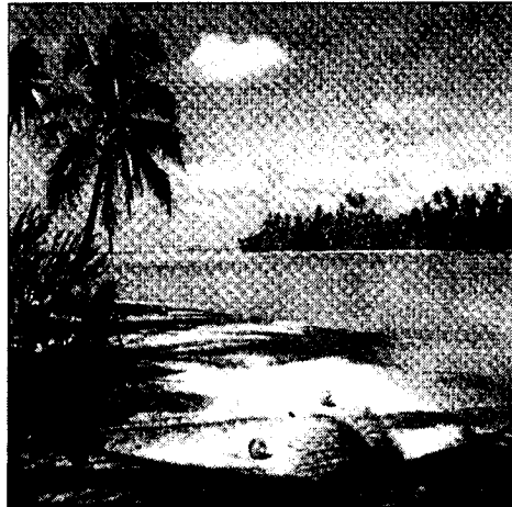
Menarik kedatangan pelancong